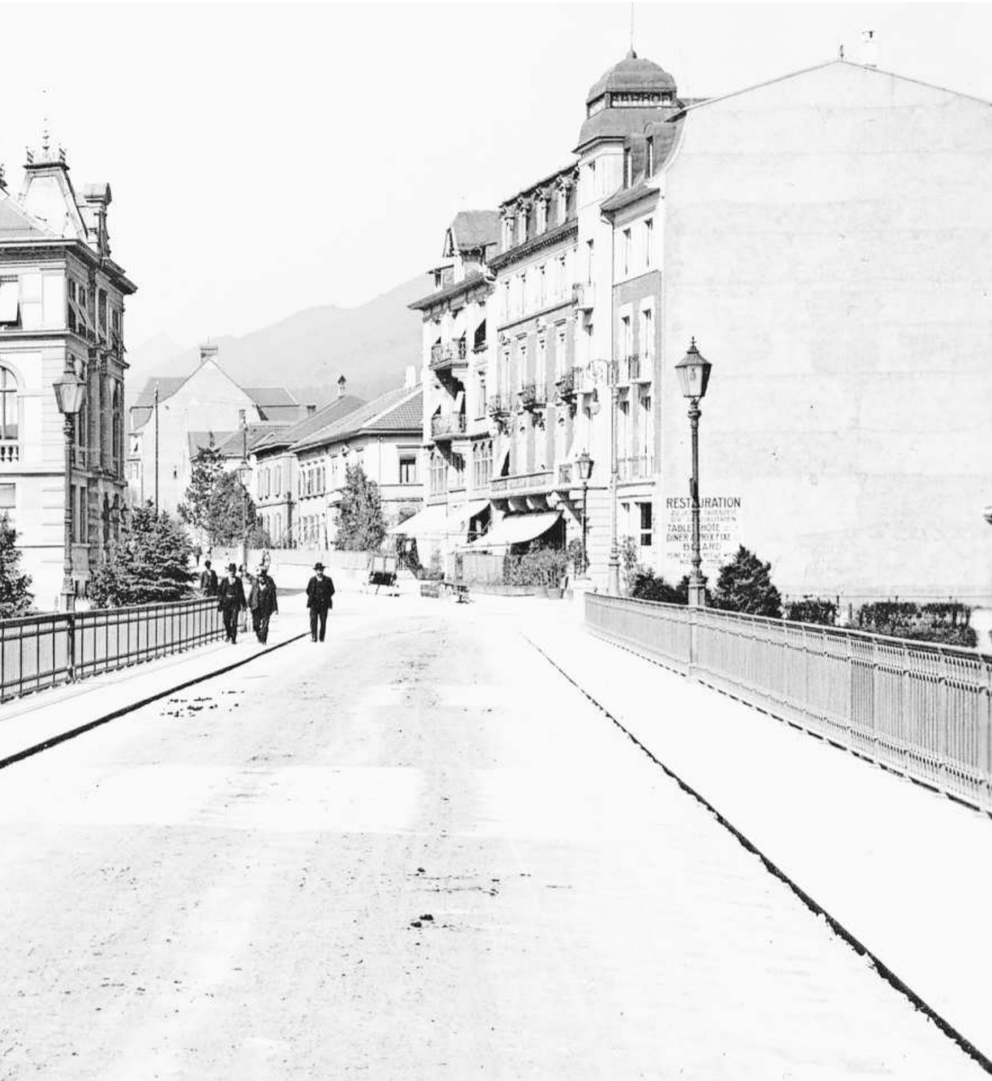
und wirkte am Bau der Repräsentativmeile mit. Rechts hinter dem «Aarhof» ist das mehrstöckige Haus seiner Familie.