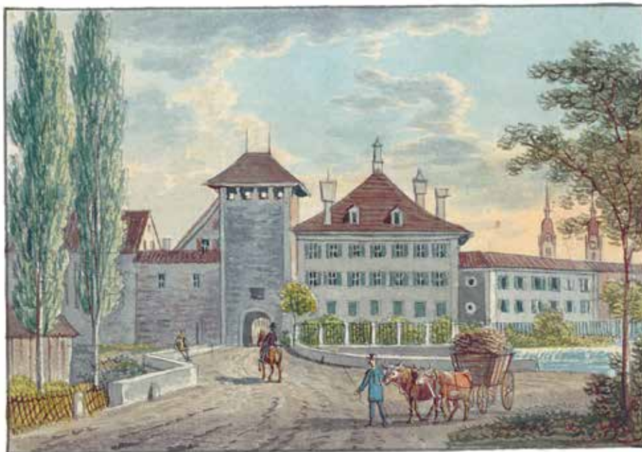
Das Untertor an der Schwelle zur Neuzeit. Blick eines unbekanntes Künstlers auf den westlichen Stadteingang um 1850.

ren Vergangenheit auf, weit über das Mittelalter hinaus war die Bezeichnung «Niedertor» oder «untere/niedere Vorstadt» gebräuchlich. Der Bezug zum hier befindlichen westlichen Stadttor liegt auf der Hand, nur wurde anfänglich der Untere Bogen, der die Marktgasse gegen den Graben (heute Kasinostrasse/Neumarkt) hin abschloss, als «Niedertor» bezeichnet. Das heutige Untertor wurde historisch als Gebiet «vor dem Niedertor» bezeichnet. Die Gasse selbst und auch das untere Tor am Bahnhofplatz trugen lange keinen Namen und gehörten auch nur halbwegs zur historischen Stadt. Kirchenrechtlich